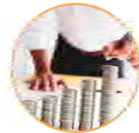
Opportunities and building capacity