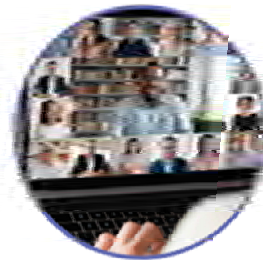
Awareness and recognition

“Access to funding was highlighted as a challenge for social economy organisations in the Social Business Initiative, and 10 years later it remains a challenge.”